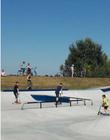
Die soziale Region

AKADEMISCHE* R EXPERT* IN FÜR KOOPERATIVE STADT- UND REGIONALENTWICKLUNG MASTER OF ARTS (MA)