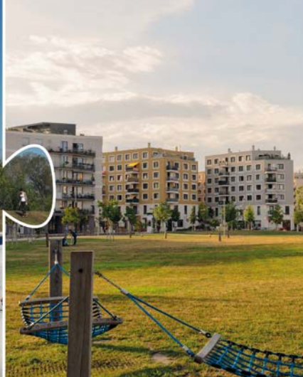
Die smarte Region