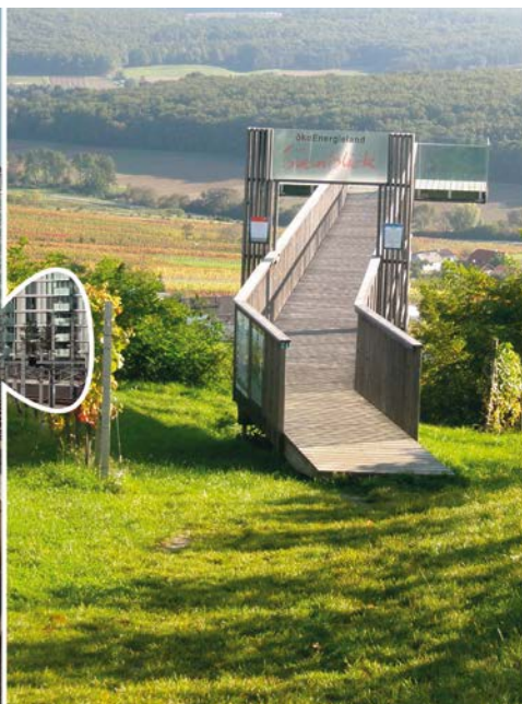
Die nachhaltige Region